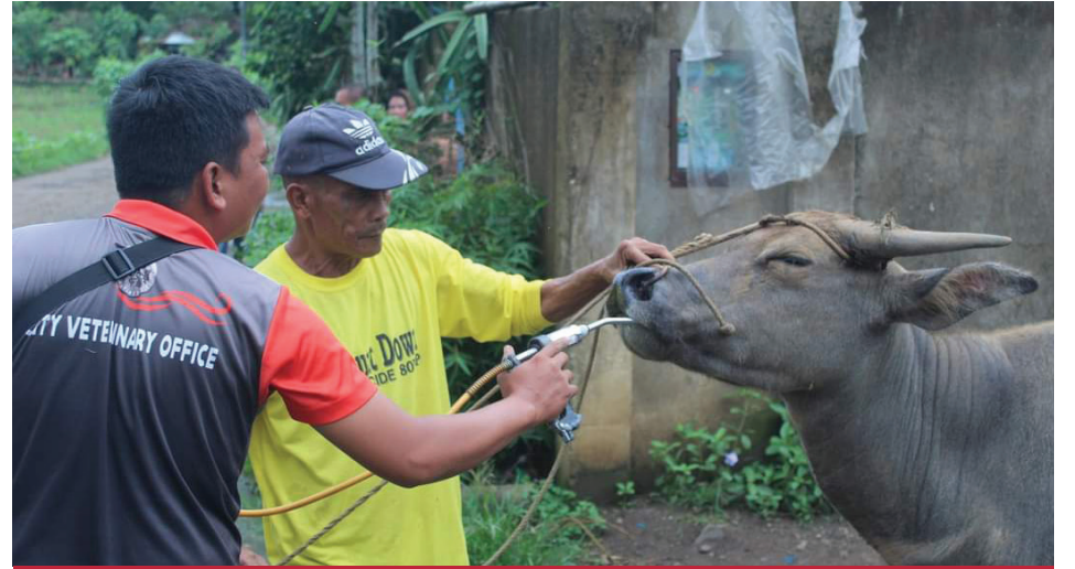
Umusbong ang bayanihan ng iba't ibang ahensya ng gobyerno sa Negros Occidental upang maserbisyoan ang mga alagang hayop ng mga lokal na magsasaka.

Mananatiling nakatuon ang DA-PCC sa pagpapalakas ng