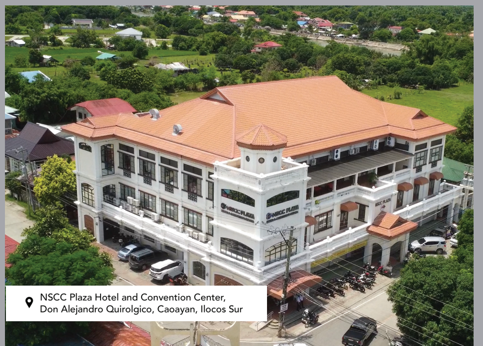
NSCC Plaza Hotel and Convention Center, Don Alejandro Quirolgico, Caoayan, Ilocos Sur

Bahagi rin ng komperensya ang paglulunsad ng DA-PCC ACPC Agri-Negosyo Credit Facility for Carabao and Dairy Farmers Program, Carabao Breed Registry, at mga talakayan sa mga paksang: Laking NCC: ‘Sang Dekadang Kwentong Katatagan at Tagumpay, ALAB Karbawan 2019-2021 CBIN/CCDP Milestones, OMK! KAI-sayang Kwento ng Laking AI, Kwentong